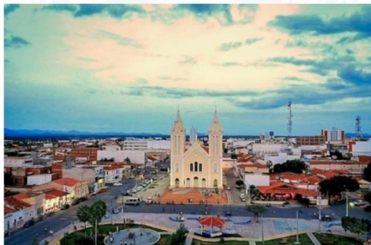
Figura 1 - Vista aérea do Município de Sousa/PB, 2024.

Atualmente, Sousa apresenta-se como um município com forte identidade histórica e cultural, combinando o legado de sua formação sertaneja com avanços na infraestrutura urbana, educacional e de saúde. Essa trajetória histórica influencia diretamente a organização social, econômica e sanitária do território, constituindo elemento fundamental para a compreensão das condições de vida da população e para a análise da situação de saúde no contexto municipal.